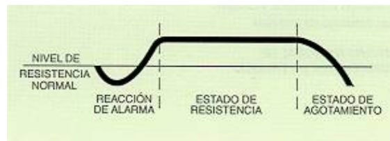
Fig. 2: Síndrome general de adaptación (Hans Selye, 1936)

En este proceso de adaptación por parte del organismo se distinguen las fases de alarma, de adaptación y de agotamiento.