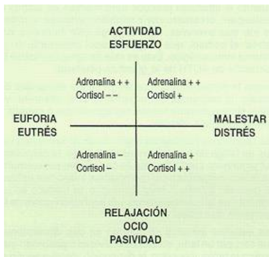
Fig. 3: Relación entre procesos de trabajo y respuestas neuroendocrinas