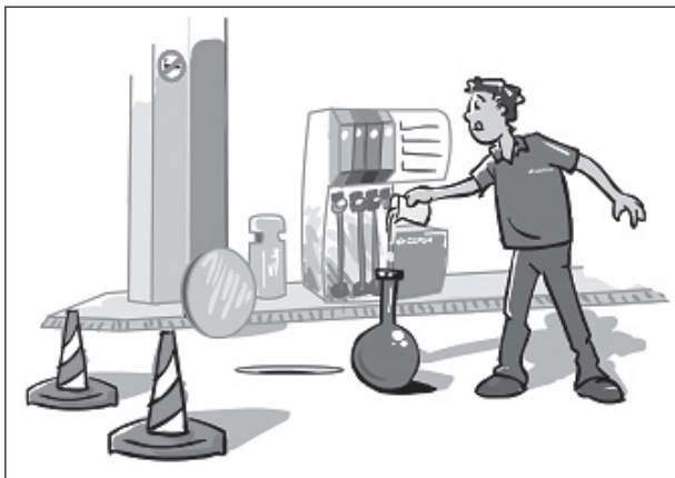
Figura 3. Metrología