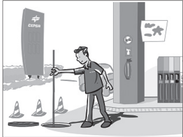
Figura 2. Varillado