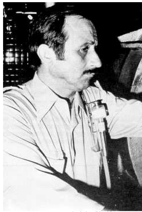
width="241" height="356"> Fig. 5: Muestreo de la fracción de polvo respirable