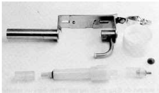
Fig .1: Componentes de la unidad de captación con ciclón