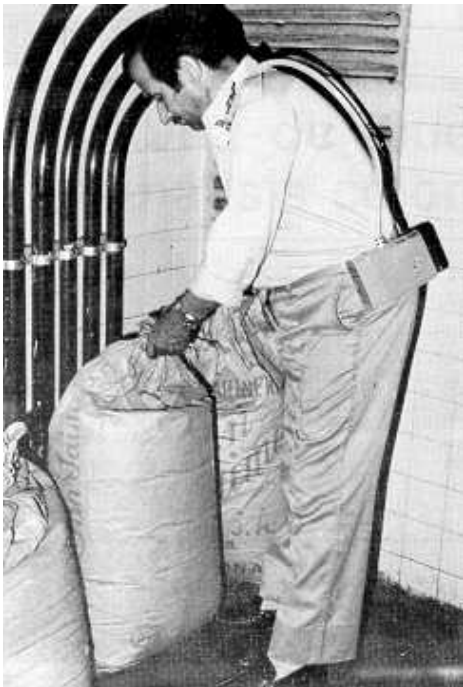
width="243" height="360"> Fig. 4: Muestreo de polvo total