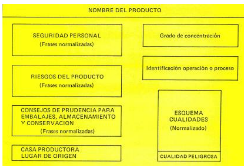
Ejemplo de posible ubicación de datos en la etiqueta

La señalización obligatoriamente identificará