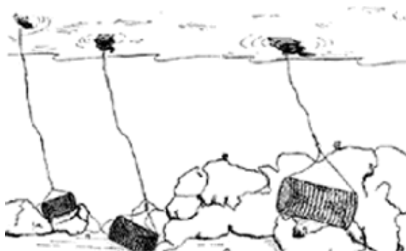
Figura 3. Nasas caladas

Las nasas se calan mediante un aparejo denominado tanda, tren o cacea, en el que cada nasa se une a una relinga llamada madre a intervalos regulares.