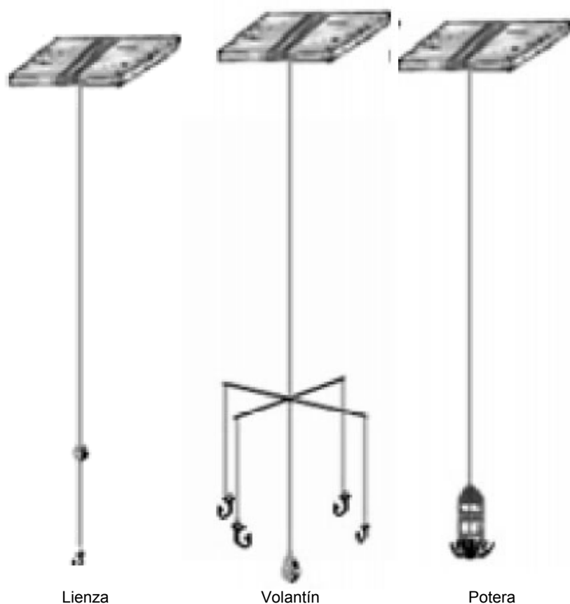
Figura 2. Artes de anzuelo