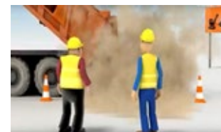
«Napo en... el polvo en el trabajo».