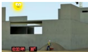
«Napo en... el estrés térmico (El duelo)».

En este folleto se describe ampliamente la serie de películas de Napo, financiadas por la Agencia Europea para la Seguridad y la Salud en el Trabajo.