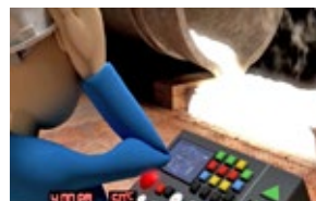
«Napo en... el estrés térmico (Del dicho al hecho)».