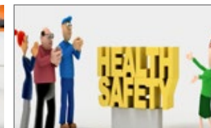
«Napo en... Yo soy un kommmittensch ».